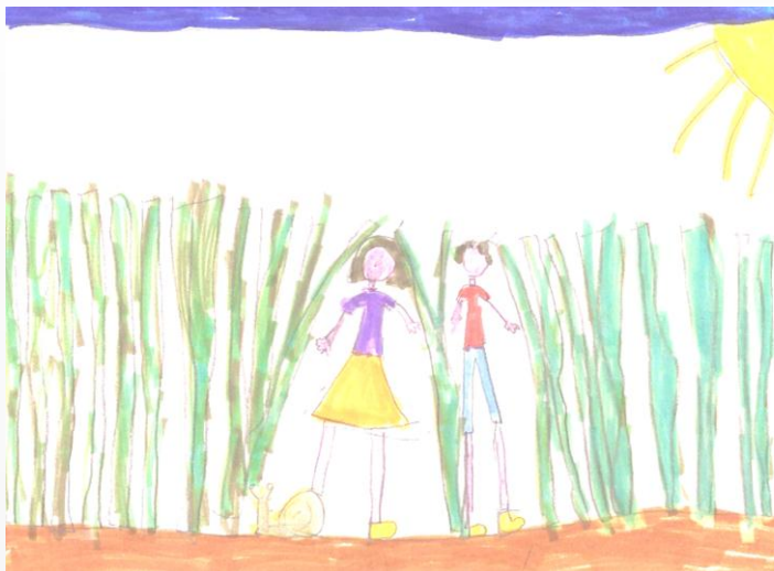
Δράση 6, 13 ο Δημοτικό Σχολείο Βόλου, τάξη: Α' Στο πλαίσιο της Δράσης πρόληψης, με θέμα την βία.

Η Α' τάξη ακολουθώντας το στόχο της συνεργασίας μεταξύ των παιδιών και το δέσιμο της ομάδας μέσω δράσεων οι οποίες εστίαζαν στη συνεργασία, στη σημασία της ομαδικότητας και στην αποδοχή του άλλου ολοκληρώθηκε με την συγγραφή ενός παραμυθιού από τους μαθητές της τάξης με τίτλο «Είμαστε όλοι φίλοι»