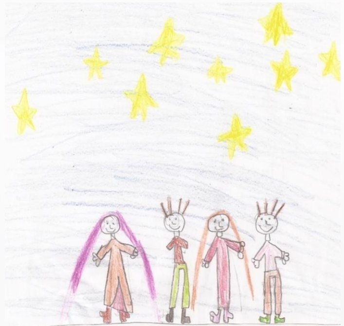
Δράση 6, 13 ο Δημοτικό Σχολείο Βόλου, τάξη: Α' Στο πλαίσιο της Δράσης πρόληψης, με θέμα την βία.

Τέλος, στην Ε' τάξη οι δράσεις στόχευαν στην αναγνώριση των συναισθημάτων του άλλου και στην θέση που μπορεί να έχει ο καθένας στην ομάδα. Προέκυψαν θέματα που είχαν να κάνουν με την ηγεσία αλλά και τις σχέσεις μεταξύ των δυο φύλων από τους ίδιους τους μαθητές του τμήματος.